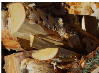
Ved på tork