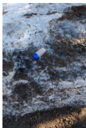
Vårskräp som tinar fram